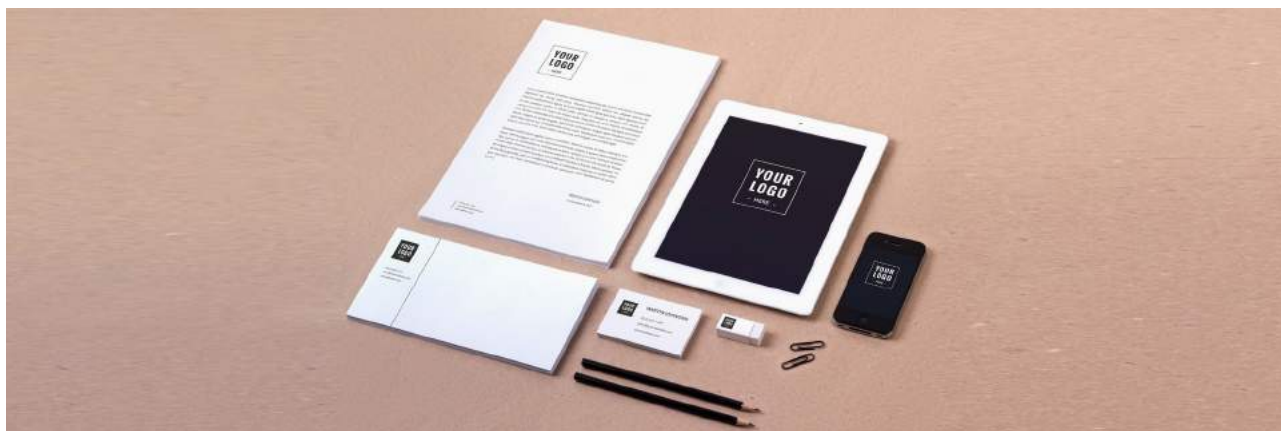
immagine coordinata aziendale

Progettazione grafica di simbolo e logotipo (unico, originale e riconoscibile) da applicare ai documenti aziendali adatta alle Piccole-Medie imprese, liberi professionisti, negozi.